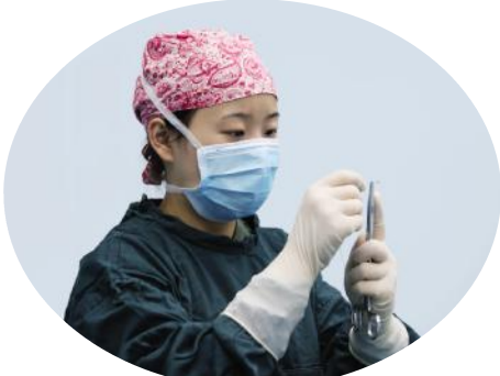
她的手略显青涩,她的心始终火热。在面对需要帮助的人时,她挺身而出,履行“救死扶伤”的职责。