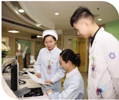
她始终坚信,一双共产党员的手,就应该是甘于奉献、为人民服务!