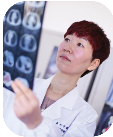
24年如白驹过隙,她的初心从未改变,地向患者伸出的治愈之手依然温暖有力……