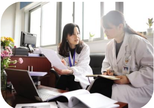
“传道授业解惑”,在一名青涩的住培学员成为合格医生的过程中,她愿用双手,培育他们成长成才。