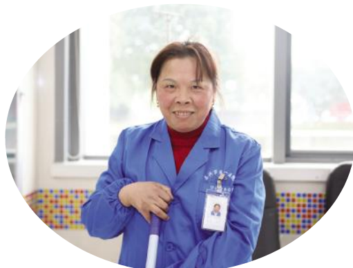
或许她的职业不如别人光鲜,但她的所作所为值得所有人尊敬。