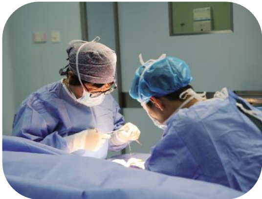
手术室封闭且寂静,但在这漫长的深夜里,她的手始终沉稳,带来生的希望。