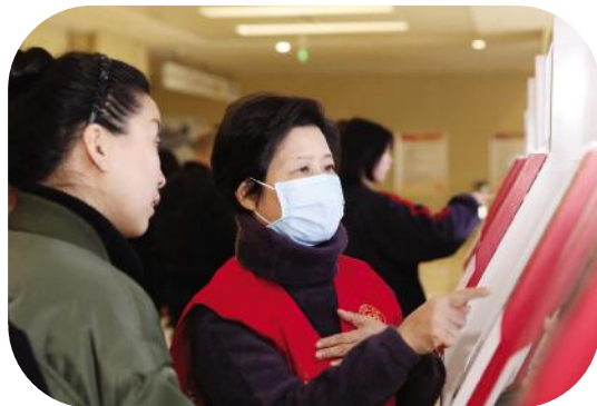
余热生辉,面对这份“新工作”,她秉持着红色情怀,延续着一名医务工作者的奉献热忱。