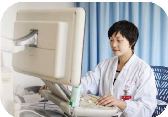
相隔4400多公里,她带去生命慰藉,用540多个日夜的坚守,书写医者对职业的神圣使命和承诺。